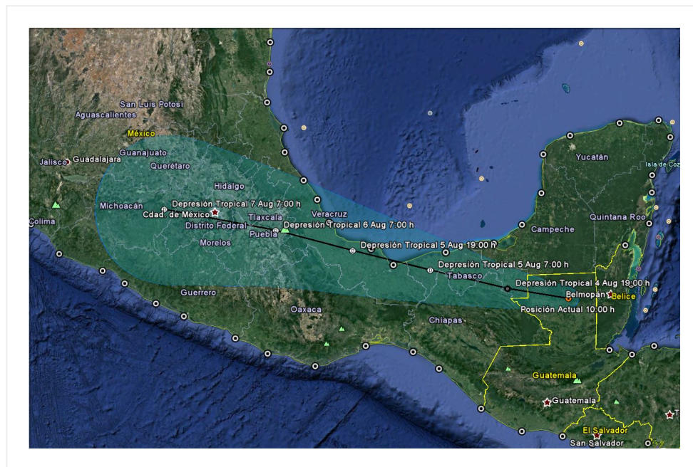
Traectoria pronóstico de la Tormenta topical "Earl"